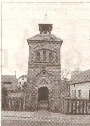
Remont kapliczki pochłonie ponad 75 tysięcy złotych.

W naborze „Borów Niemodlińskich” wzięło udział 8 podmiotów, w większości będących samorządami terytorialnymi. Łącznie do podziału było ponad 1,3 miliona złotych. Jedyny wniosek złożony przez Urząd Gminy w Strzeleczykach zabiegał o uzyskanie 47 149 zł, podczas, gdy całość przedsięwzięcia ma kosztować około 72,5 tys. zł.