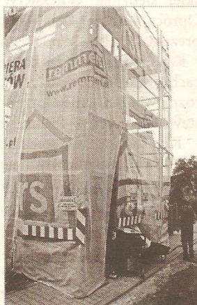
Pieniądze na remont wyłożyła Unia Europejska.

Ekipa remontowa rozpoczęła pracę przed dwoma tygodniami. Zadaniem budowlanców jest poprawa stanu obiektu, który przez lata pogarszał się z powodu bliskości drogi i warunków atmosferycznych. Koszt inwestycji to 72,5 tysiąca złotych, z czego 47 149 zł stanowi wsparcie z Unii Europejskiej.